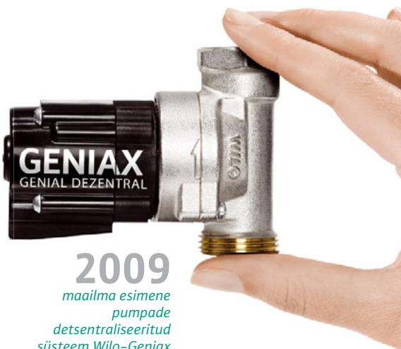
2009 maailma esimene pumpade detsentraliseeritud süsteem Wilo-Geniax