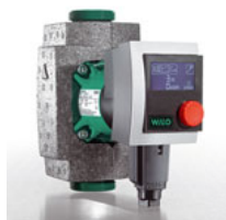
2009 energeetiliselt kõrg- efektiivne pump Wilo-Stratos PICO eriti väikese elektritarbega ELi poolt ette nähtud alates 2013