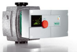
2001 esimene energeetiliselt kõrgeefektiivne pump Wilo-Stratos ELi poolt ette nähtud alates 2013